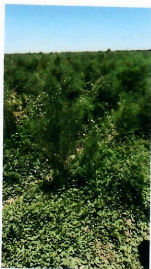
Cultivo de Espárrago orgánico