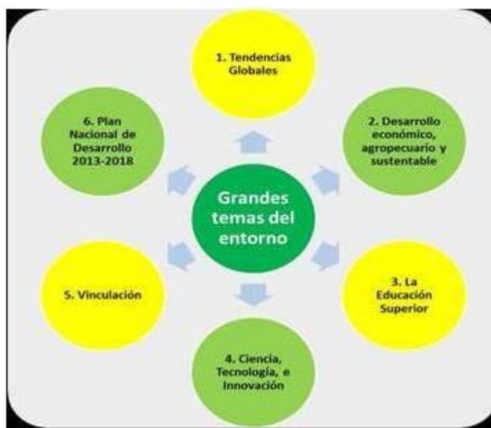
Figura 6. Grandes temas del entorno de la UAAAN

Para la realización de esta etapa, se seleccionaron SIETE grandes temas sobre los que se efectuó un análisis de documentos escritos por autores reconocidos, y también la realización de una Consulta Externa. En la figura 6 se muestran los temas de referencia.