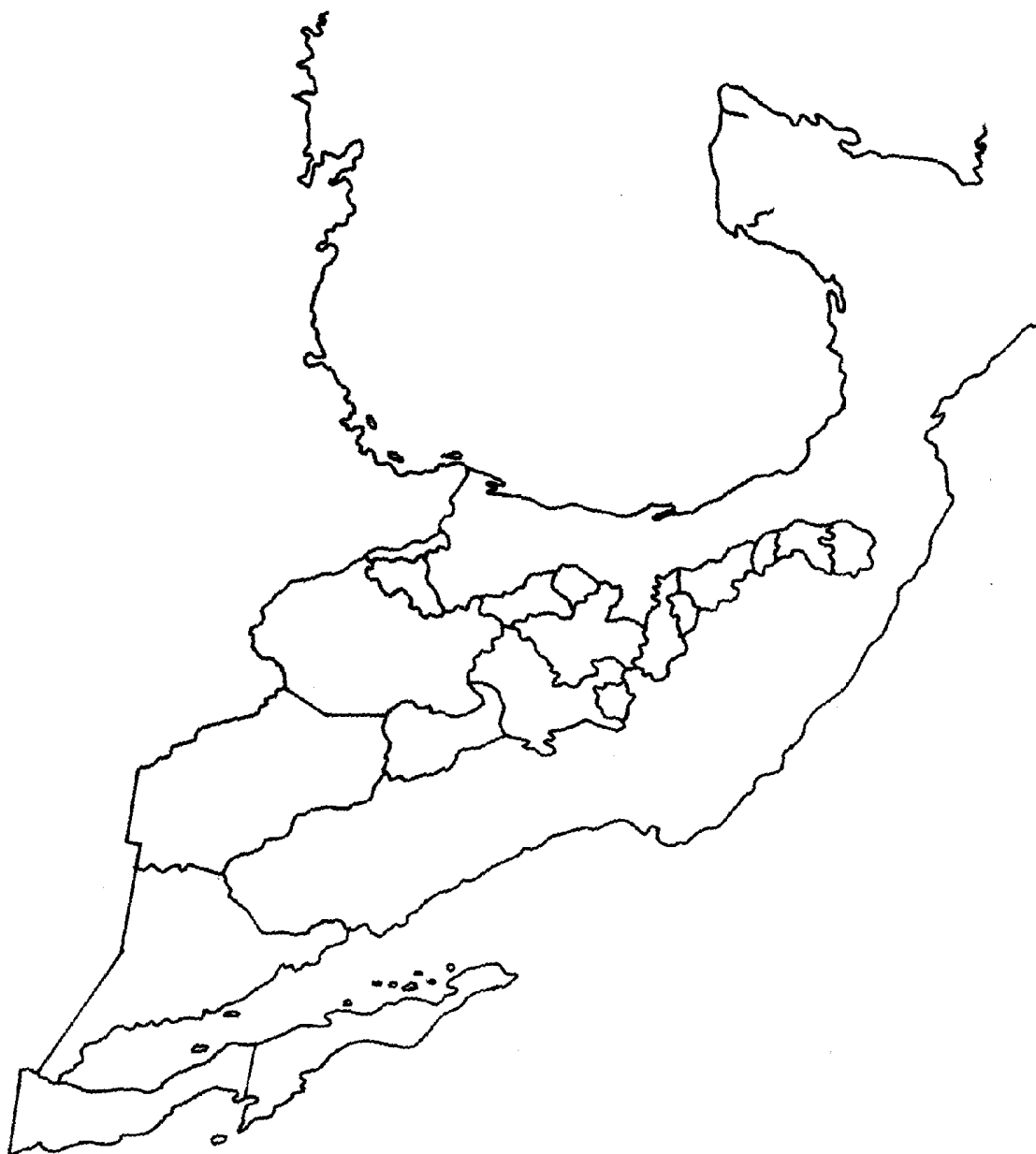
MAPA 1. Área de influencia general de la investigación de la Universidad Autónoma Agraria Antonio Narro, donde se realtan las regiones de las zonas áridas.