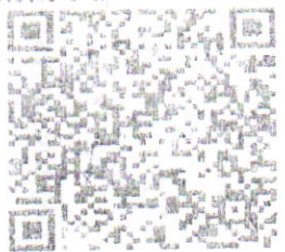
Expedido En: 76039

Cadena original del complemento de certificación digital del j1115E2AF4C1-2BC3-4BA9-A6C6-4021BCFE36B7|2019-10- 06T12:31:26PPD501123EA j0ICGhLdqRqRNDjg2FE4AM5BEHCE.N9S1XIEE7sPZEDApAZ Fmb4eb3GruSZF7RhoXo3tUgD4OR81RR0SGgvFuh5ARZ0C 'kLw571tccAqpyvS8NM16QmPmthYAV603V9pdZEo27QmJDMW oRNNH45NCDee+eCIXD53gIDL50zJoDJogh6 +Y56KPI0680VNUJmMj10B9OF0Kpkmuc9FmNuvVtoY9g6Ood qKCGm73p0qZLje0Y11Q8v5Joc0b57C0J0K14WF6nLp519ghZ p0q12W8h9jWz1TeS2Y1G0J0Y1L1RjWfRZ0W0Yz0MeEjg ==0000100000404624465